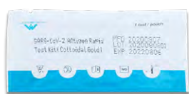
TEST KIT POUCH

Als Probematerial dient ein besonders schonender nasaler Abstrich, das in einem Reagenz aufgelöst und auf eine Testkassette tropfenweise verabreicht wird. Das Ergebnis wird nach spätestens 15 Minuten durch eine Färbung auf dem Teststreifen angezeigt.