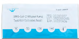
TEST KIT POUCH